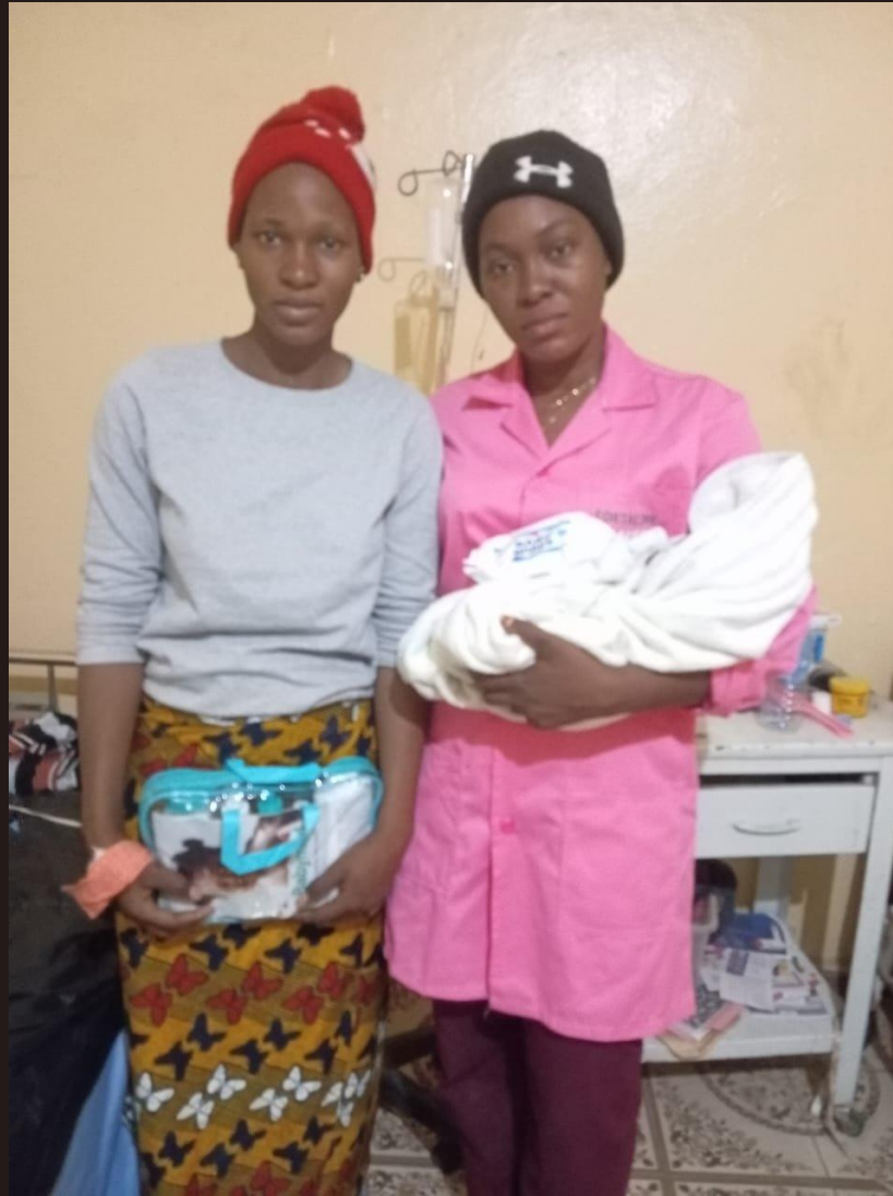
Accompagnement à la naissance et kit d'hygiène