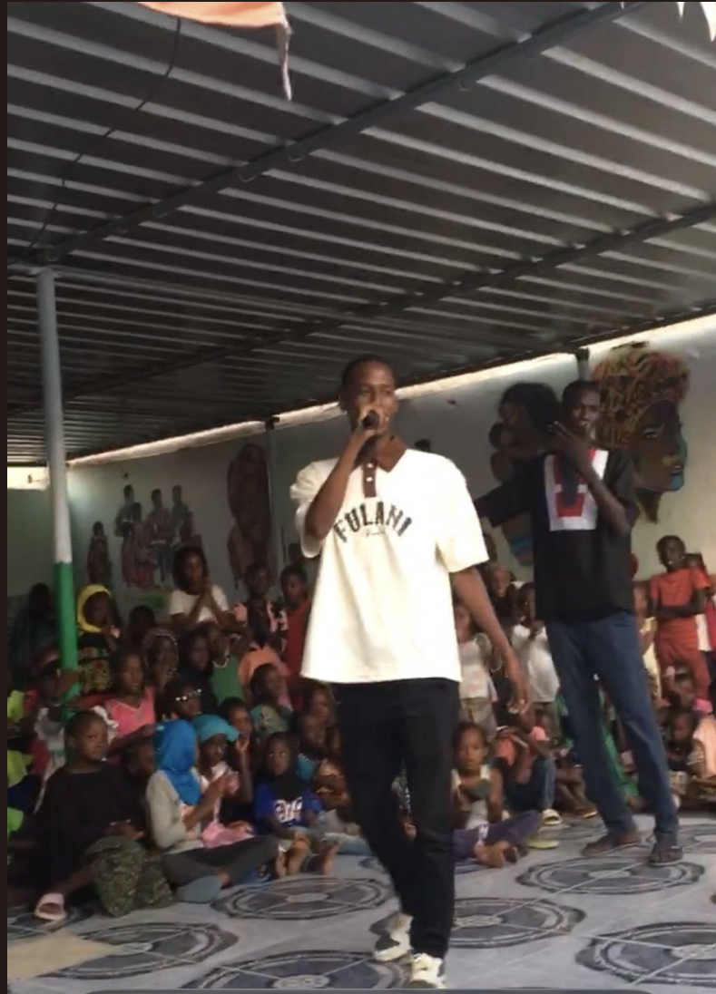
Animation musicale avec les enfants