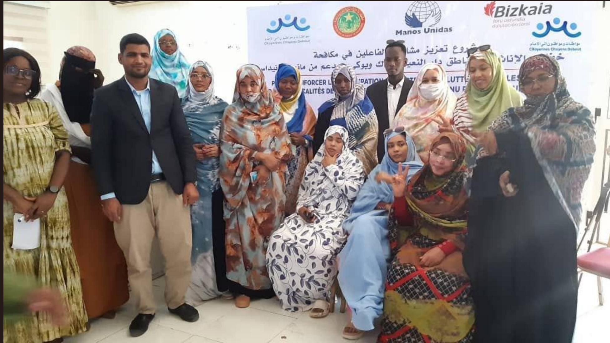
Projet « Renforcer la participation » — avec Manos Unidas & Bizkaia