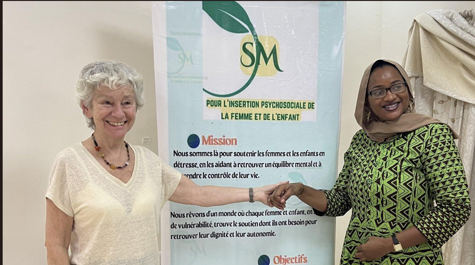
Insertion psychosociale de la femme et de l'enfant