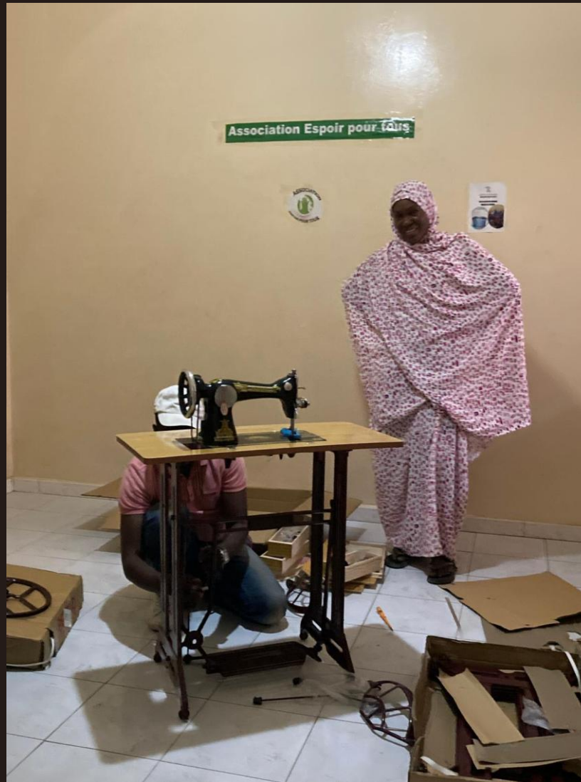
Réception d'une machine à coudre offerte par ASMApsy