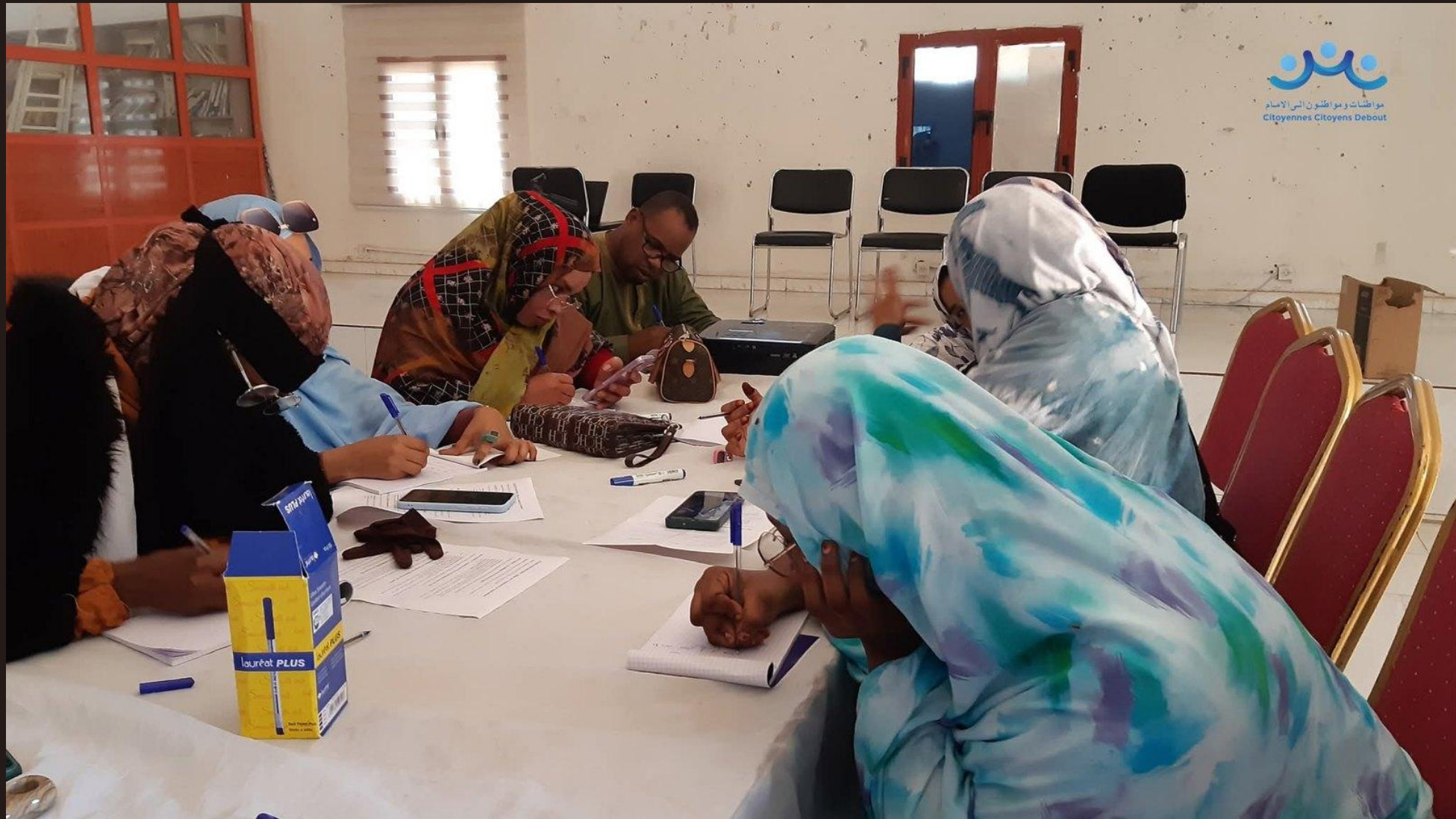
Session de formation des actrices de terrain