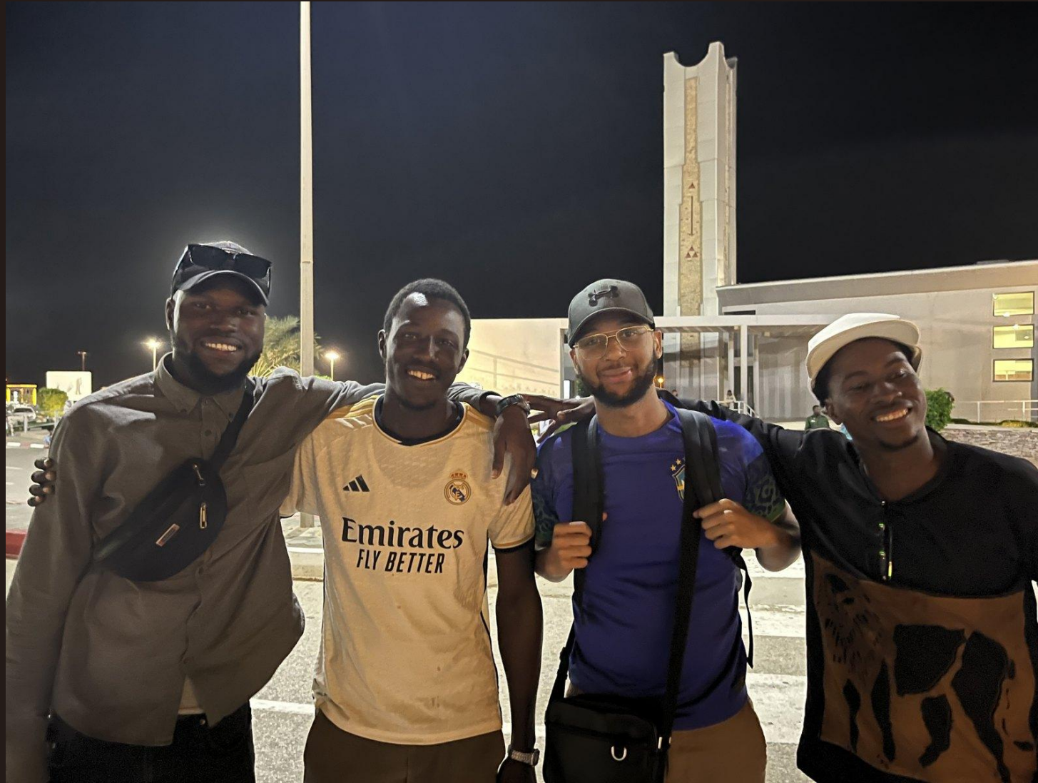
L'équipe de l'association APEFAS