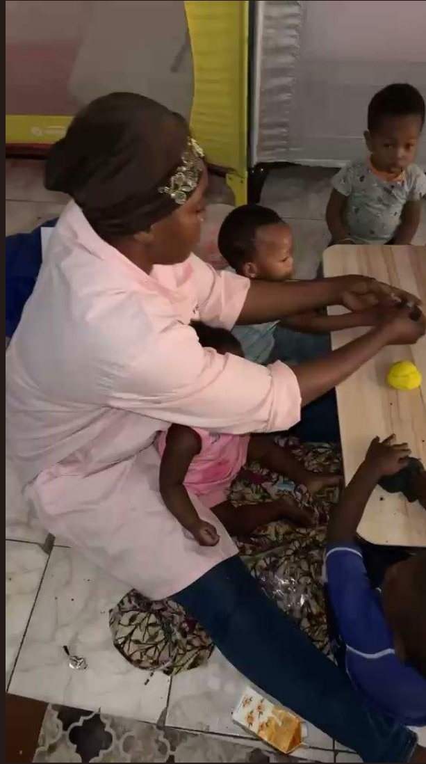
Atelier d'éveil avec les enfants